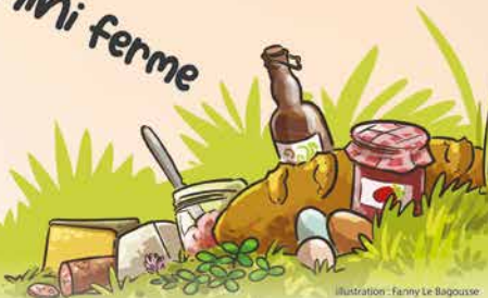
Illustration : Fanny Le Bagousse

Renseignements, infos et programme : www.ccmatheysine.fr 04 76 81 18 24