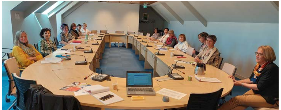
Les travailleurs sociaux de la CAF de Caen.

Ces dispositifs, associés à une sensibilisation aux économies d'énergies, permettent aux travailleurs sociaux d'accompagner plus efficacement les personnes en difficultés de paiement. Une belle façon pour les travailleurs sociaux de la CAF de construire des solutions personnalisées qui répondent aux besoins de leurs bénéficiaires.