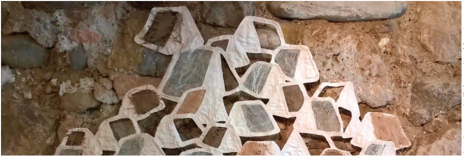
Jungle canopée © Amandine Meunier

Avec ce projet, Médiarts et le Département de l'Isère invitent les habitants à découvrir une démarche artistique singulière celle notamment de l'artiste plasticienne Amandine Meunier, en résidence de médiation en Matheysine en 2021 et à participer à des ateliers avec l'artiste.